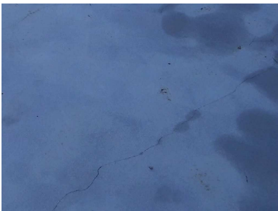
Konstruktivna pukotine u betonskoj ploči

Pukotine u armirano-betonskim zidovima obrađuju se injektiranjem na način da se uzduž pukotine ugrade pakeri u cik – cak rasteru. Kroz pakere se u pukotinu injektira epoksidna smola. Nakon stvrdnjavanja smole rupe od pakera se zatvaraju ili epoksidnim mortom ili cementnim reparaturnim mortom DRACO® FIX 130 , nakon čega slijedi eventualno brušenje i usisavanje prašine.