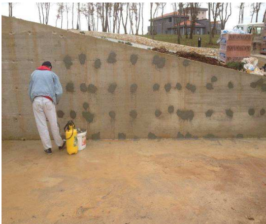
Zatvaranje rupa od distancera