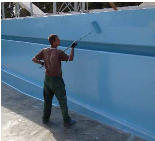
Nanošenje boje valjkom na zid

Završni sloj se izvodi od epoksidne boje DRACO® POOL 800 . Proizvod se nanosi kratkodlakim valjkom u dvije ruke. Druga ruka proizvoda se nanosi nakon sušenja prve ruke. Ukoliko se želi postići protukliznost površine u prvu ruku premaza se dodaje kvarcni pijesak čiji višak se odstranjuje nakon sušenja boje.