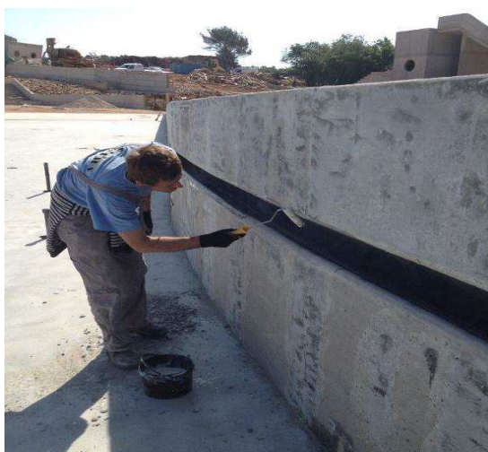
Nanošenje prajmera na zid

Prajmer se nanosi u dva ili tri sloja, ovisno o vlažnosti podloge. Kod podloge sa zadržanom vlagom, tri sloja su potrebna kako bi se postigla barijera za vlagu. Svaki sloj prajmera se nanosi u razmaku od cca 24h.