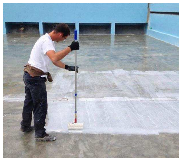
Nanošenja prajmera na podnu ploču