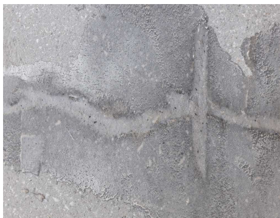
Sanirana konstruktivna pukotina