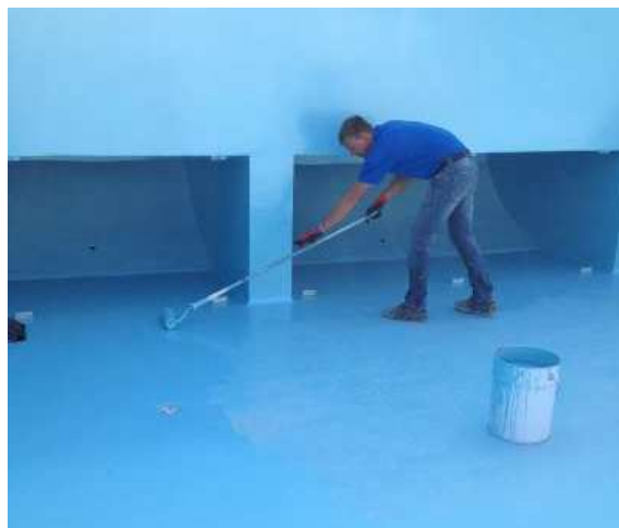
Nanošenje boje valjkom na pod