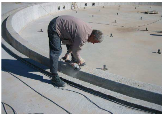
Brušenje preljevnog kanala